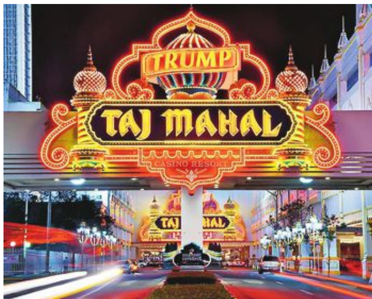
Trump Taj Mahal i Atlantic City stängde för gott i förra månaden.